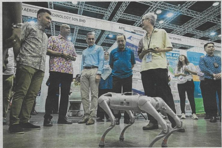
Ramanan melawat tapak Karnival Kerjaya Premium MYFutureJobs 2026 di Pusat Konvensyen Kuala Lumpur, semalam.

Katanya, teknologi AI itu mampu membangunkan portfolio pencari kerja secara automatik selain memadankan mereka dengan pekerjaan yang menawarkan gaji terbaik mengikut kemahiran dan pengu-